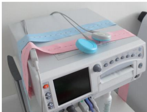
Figura 1. Monitor Cardiotocográfico