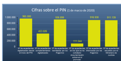
Figura 1. Plan Intensivo de tramitación de expedientes de Nacionalidad. Cifras sobre el PIN