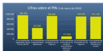
Figura 1. Plan Intensivo de tramitación de expedientes de Nacionalidad. Cifras sobre el PIN