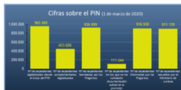
Figura 1. Plan Intensivo de tramitación de expedientes de Nacionalidad. Cifras sobre el PIN