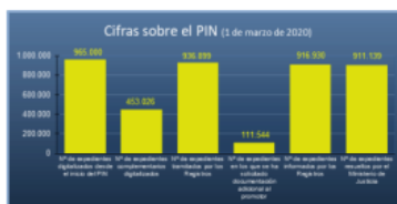
Figura 1. Plan Intensivo de tramitación de expedientes de Nacionalidad. Cifras sobre el PIN